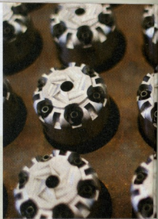
4 MILA ADDETTI Alcune fasi della lavorazione di armi, da caccia e non, nel distretto bresciano. Qui lavorano una quindicina di grandi aziende e un centinaio di subfornitori e imprese artigiane, con un totale di quasi 4 mila addetti.